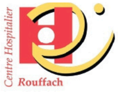
Plan du Centre hospitalier de Rouffach